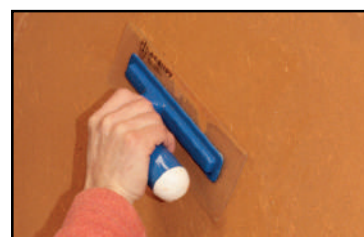
Étape 4 - à mi séchage, resserrer l'enduit à l'aide d'une spatule plastique souple.