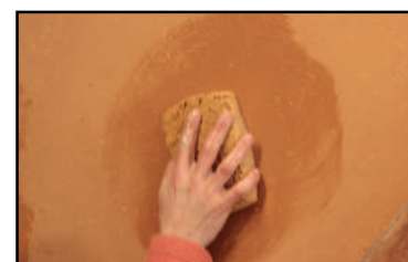
Étape 5 - une fois l'enduit sec, passage d'une éponge semi-humide afin de faire tomber les poussières de surface et faire ressortir le lin.