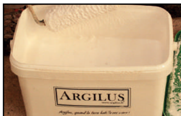
Bac sous-couche d'accroche Argilus