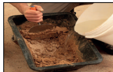
Étape 2 - préparation et humidification de l'enduit (spatule ou malaxeur)