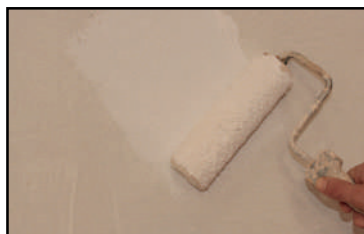
Étape 1 - application au rouleau de la sous-couche d'accroche Argilus.