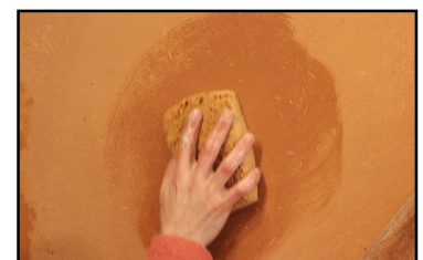
Étape 5 - une fois l'enduit sec, passage d'une éponge semi-humide afin de faire tomber les poussières de surface et faire ressortir le lin.