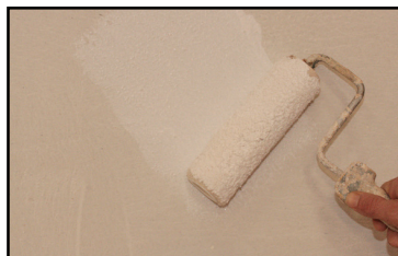
Étape 1 - application au rouleau de la sous-couche d'accroche Argilus.