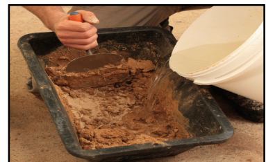
Étape 2 - préparation et humidification de l'enduit (spatule ou malaxeur)