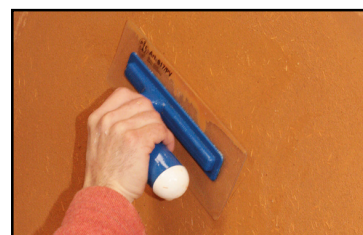
Étape 4 - à mi séchage, resserrer l'enduit à l'aide d'une spatule plastique souple.