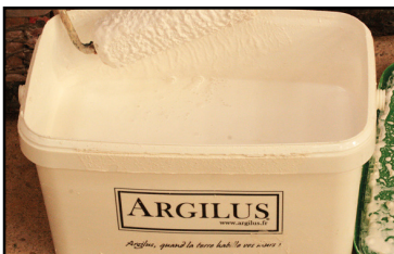
Bac sous-couche d'accroche Argilus